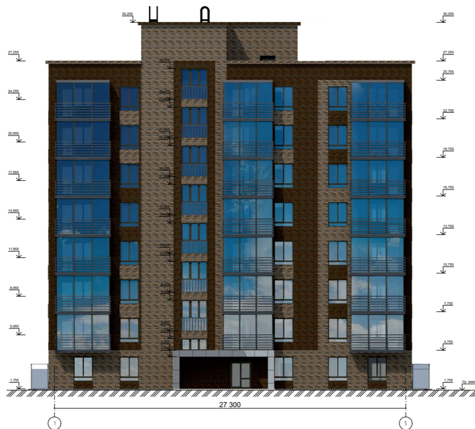
Фасад в осях 1-5