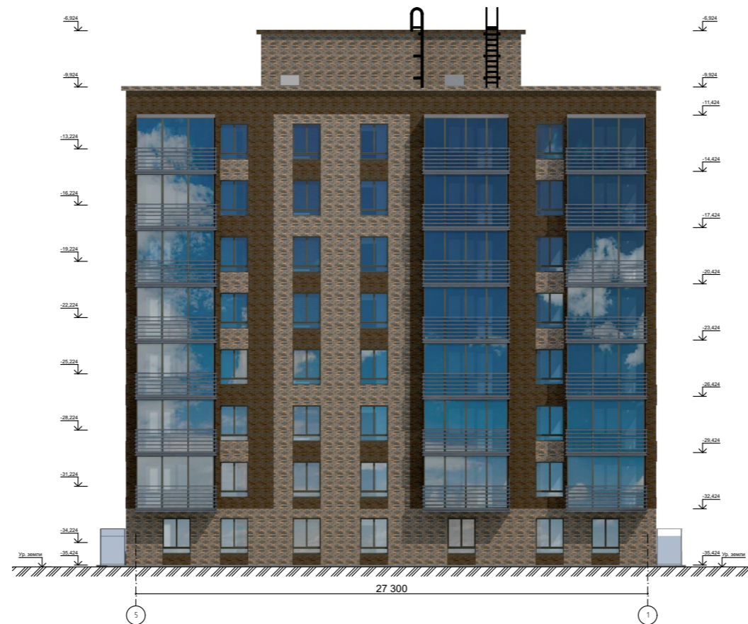
Фасад в осях 5-1