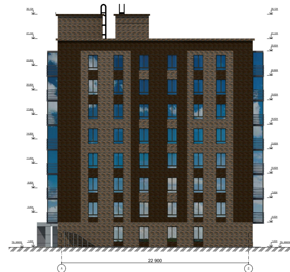
Фасад в осях А-Д